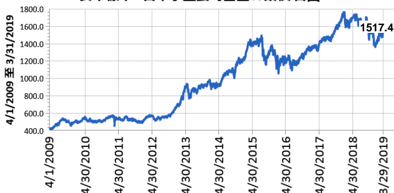
— 安本標準 - 日本小型公司基金 A 累積日圓

二、最近十年度基金淨值走勢圖：（僅列示主要銷售級別 A 累積日圓類股份，投資人得向總代理人要求提供未揭示之在臺銷售級別資訊）