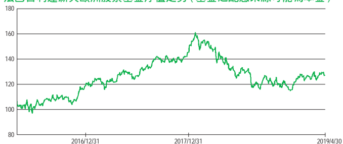
法巴百利達新興歐洲股票基金淨值走勢 (基金之配息來源可能為本金)