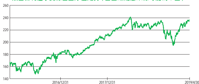
法巴百利達水資源基金淨值走勢 (基金之配息來源可能為本金)