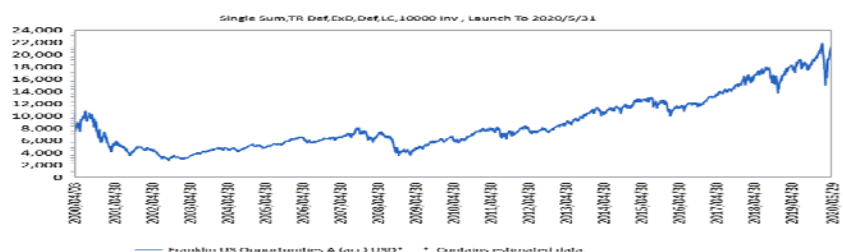
成立以來投資成長圖(期初單筆投資一萬元、原幣計價迄2020/5月底,資料來源:理柏)