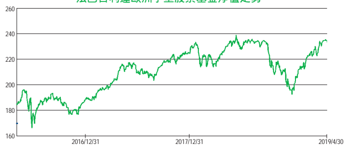
法巴百利達歐洲小型股票基金淨值走勢